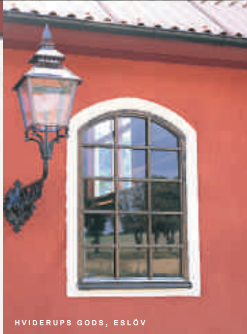
HVIDERUPS GODS, ESLÖV