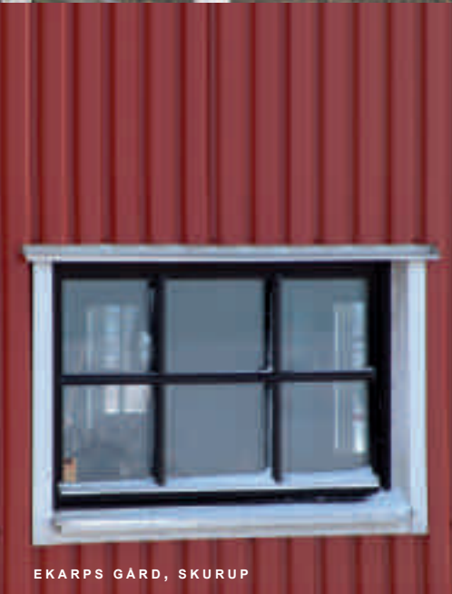
EKARPS GÅRD, SKURUP