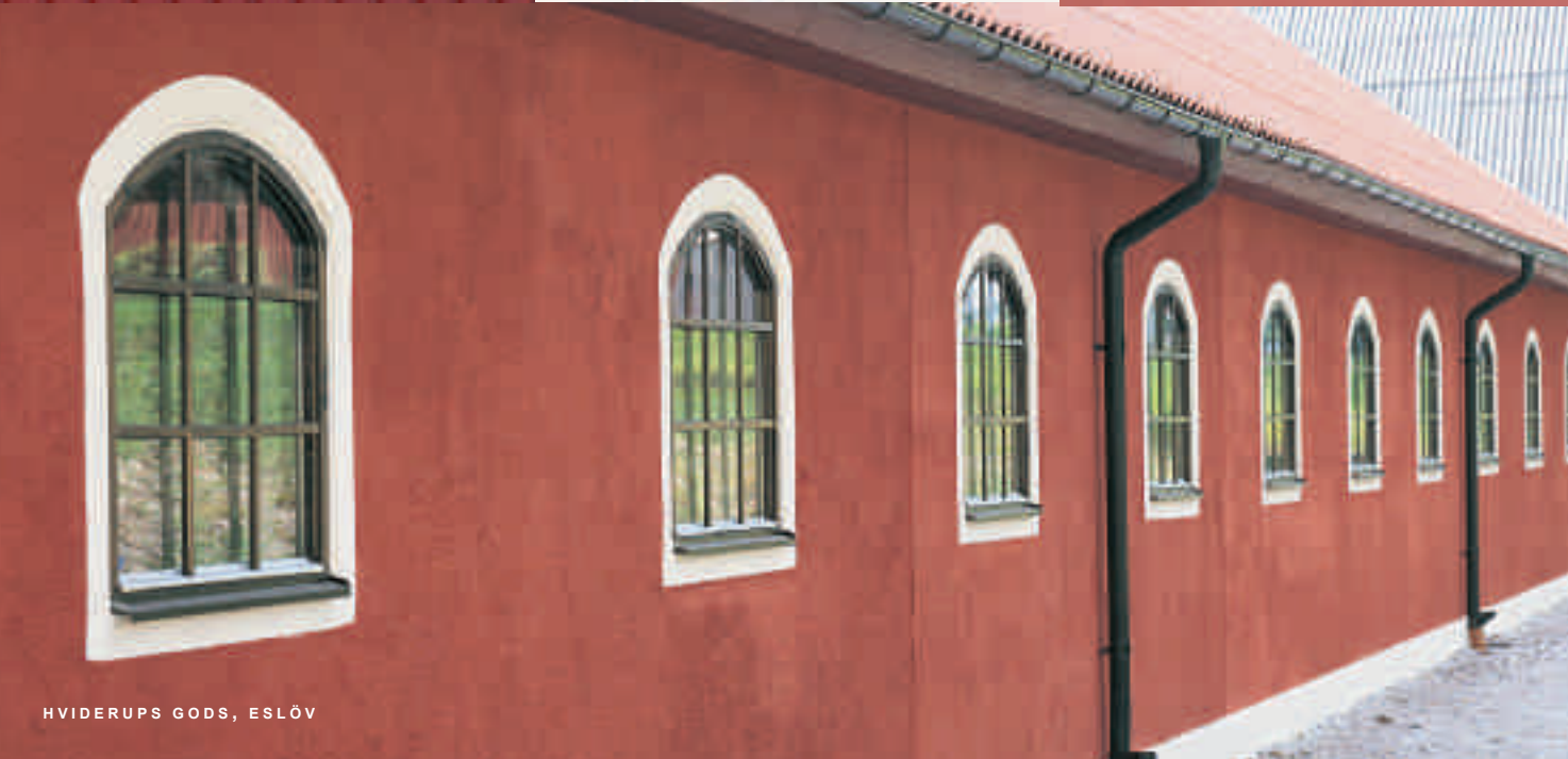
HVIDERUPS GODS, ESLÖV